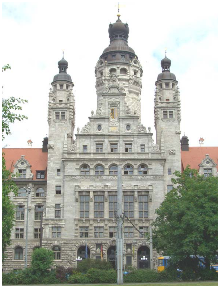
Neues Rathaus, Leipzig