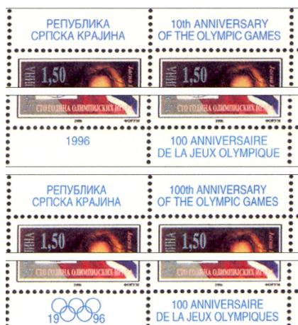
Bild 4: Darstellung, die die Unterschiede bei der MiNr. 61 zwischen beiden Drucken erkennen lässt

Die Briefmarke mit der Michel-Nr. 22 wird fälschlicherweise als Einschreibemarke beschrieben, tatsächlich wurde sie jedoch nur verwendet, um die Zusatzgebühr für eingeschriebene Post abzudecken, während der Brief selbst, wie jeder andere auch, eigens zu frankieren war, es handelt sich also um eine Einschreibezuschlagmarke. Diese (einheitliche) Einschreibengebühr betrug zum Zeitpunkt der Ausgabe 23.600 Dinar (die als Nominale im Katalog angegebenen 36.100 Dinar für diesen Zweck sind falsch und wären die tatsächliche gesamte Gebühr für einen einfachen, eingeschriebenen Brief der ersten Gewichtsstufe). Die Einschreibengebühr hat sich mit den Tarifänderungen verändert, diese R-Marke blieb in Gebrauch bis August 1995 im westlichen und bis zum 1. März 1997 im östlichen Teil der RSK.