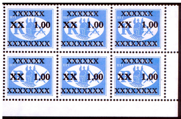
Bild 5: Zwei unterschiedliche Aufdrucktypen ; MiNr. 72 F Typen I & II

Daneben gibt es noch eine zweite und weit interessantere Variante der Michel-Nr. 72. Die niedrigeren Wertstufen der Michel-Nrn. 68 bis 72 wurden in der Farbe Rot überdruckt, die Michel-Nrn. 73 bis 77 (die höheren Wertstufen) in der leichter zu lesenden schwarzen Farbe. Der Wechsel in den Aufdruckfarben führte zu einer interessanten Farbvariante, dem schwarzen Aufdruck auf der Michel-Nr. 72, der eigentlich nicht geplant war. Es ist bekannt, dass nur drei solcher Bogen erhalten blieben. Nachdem sie in jeder anderen Hinsicht mit der regulären Michel-Nr. 72 identisch war, wurde eine gewisse Menge dieser Marke mit schwarzem Aufdruck (wir wollen sie Nr. 72 F nennen) im regulären Postverkehr verbraucht (eine interessante philatelistische Kuriosität).